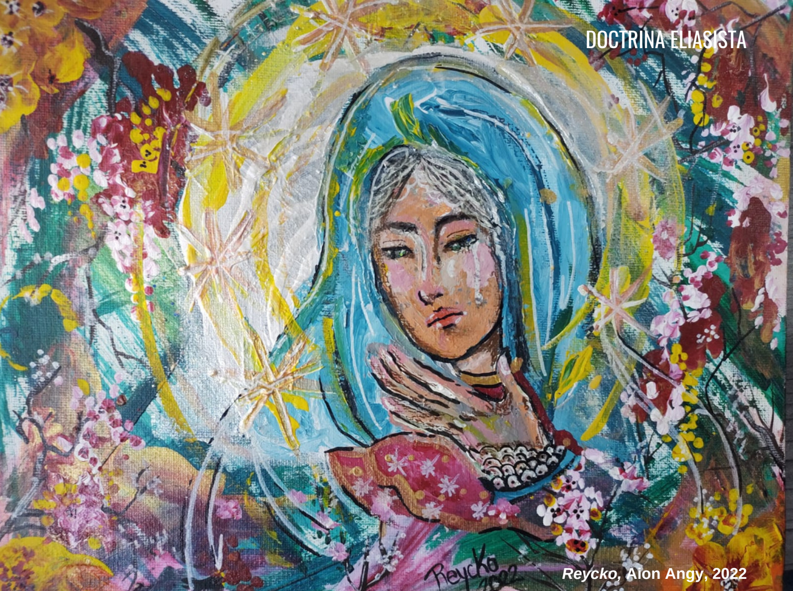
Reycko, Alon Angy, 2022