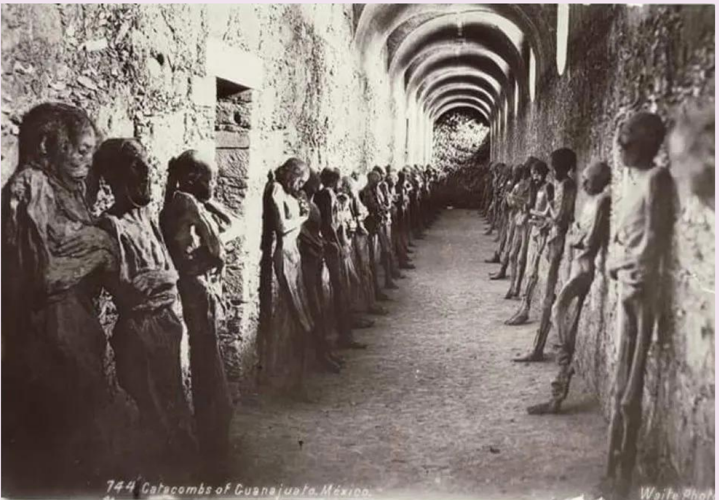
744 Catacombs of Guanajuato, Mexico.

Poco a poco la gente se fue dando cuenta de estas momias y se generó mucha popularidad, tan es así que se creó la novela "Las momias de Guanajuato" y más tarde